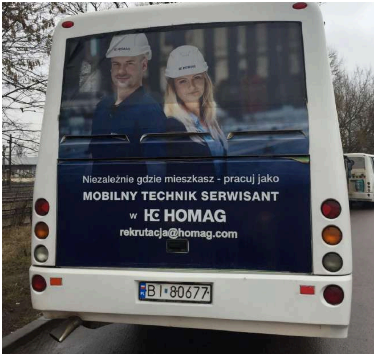
Zdjęcie autobusu po oklejeniu reklamą tylnej części karoserii wraz z szybą