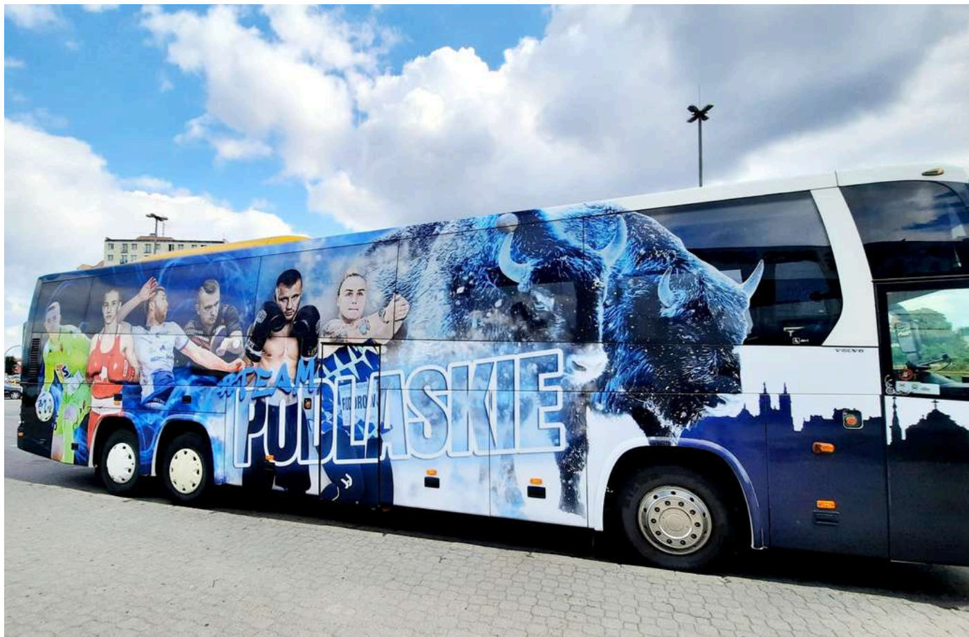
Zdjęcie autobusu po całym jego oklejeniu