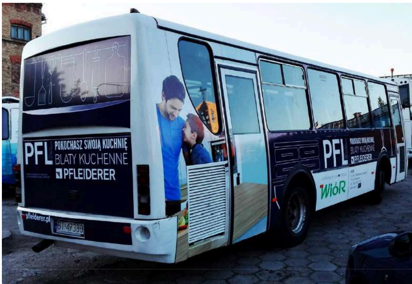
Zdjęcie autobusu po oklejeniu reklamą tylnej części karoserii wraz z szybą